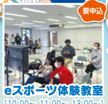
eスポーツ体験教室 [10:00~、11:00~、13:00~]