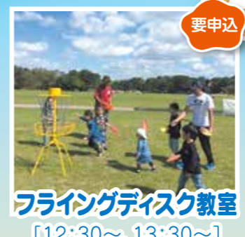
フライングディスク教室 [12:30~、13:30~]