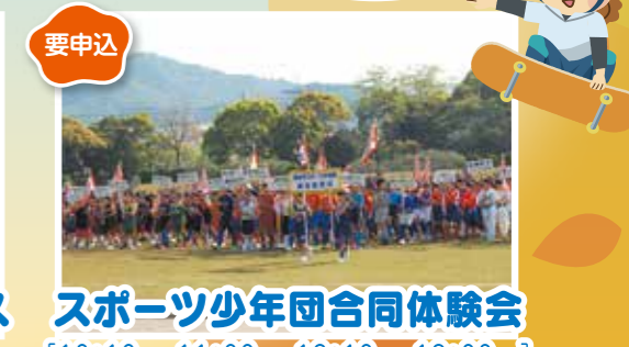
スポーツ少年団合同体験会 [10:10~、11:00~、12:10~、13:00~]