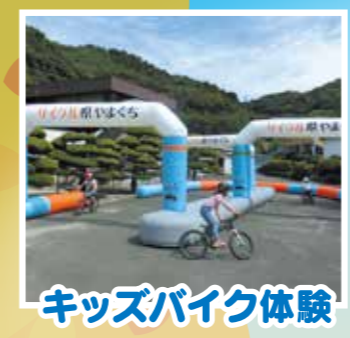
キッズバイク体験