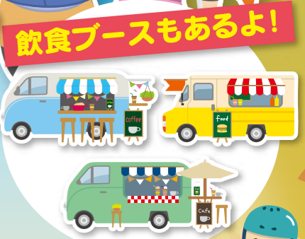
飲食ブースもあるよ!