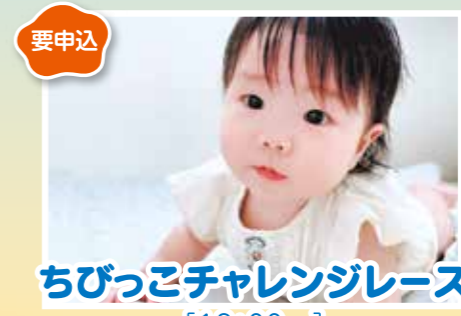
ちびっこチャレンジレース [13:00~]