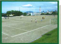
補助サッカー場(運動広場)